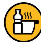
Huile de friture