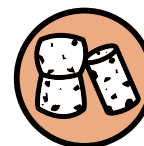
Bouchons en liège