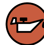
Huile de vidange