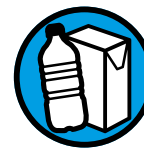
Bouteilles plastique, briques alimentaires