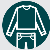
Vêtements amples et couvrants