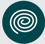
Serpentins à l'extérieur