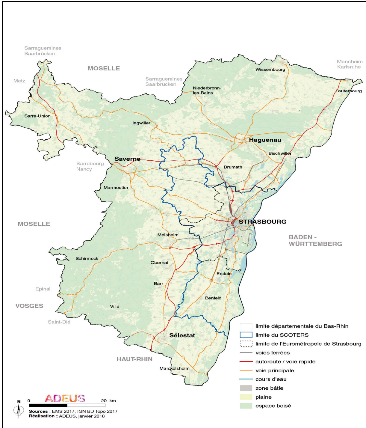
CARTE N°2 : L'Eurométropole de Strasbourg dans le SCOTERS et dans le Bas-Rhin