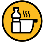
Huile de friture