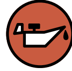
Huile de vidange