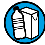
Bouteilles en plastique, briques alimentaires