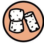
Bouchons en liège