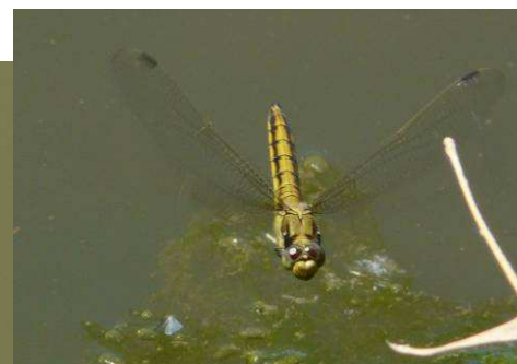
Orthetrum cancellatum mâle, et femelle en vol stationnaire lors de la ponte