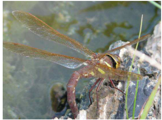
Aeschna grandis femelle en train de pondre