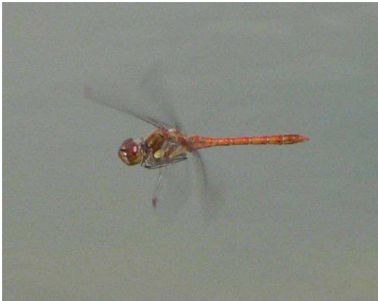
Sympetrum striolatum mâle