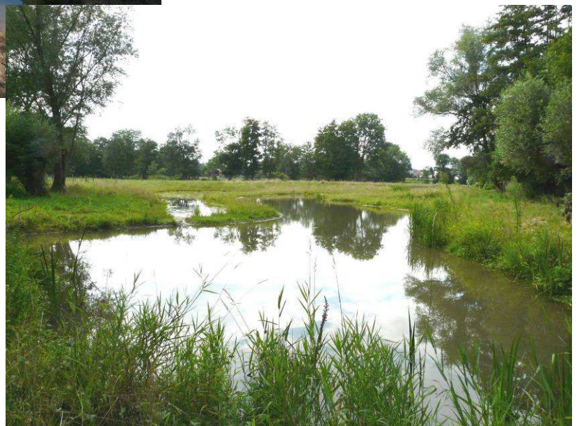
Vue du 13/8/2010 : On peut apercevoir au fond la suppression des peupliers de cultures, coupés à l'automne 2009.