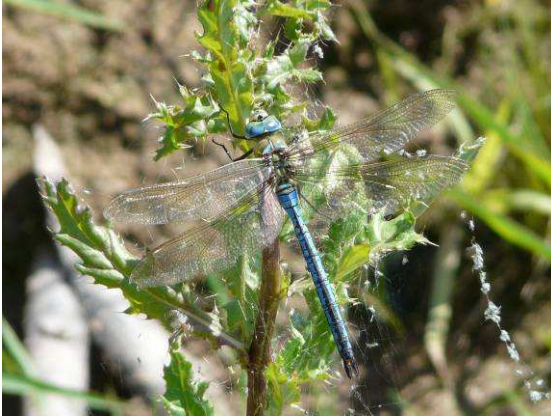
Anax imperator mâle