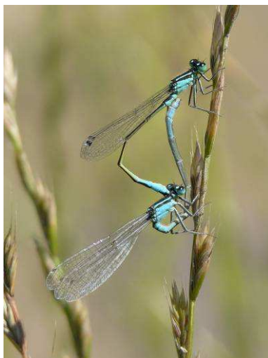
Accouplement d' Ischnura elegans