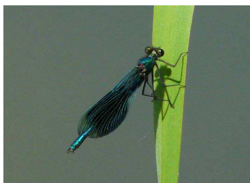
Calopteryx splendens mâle