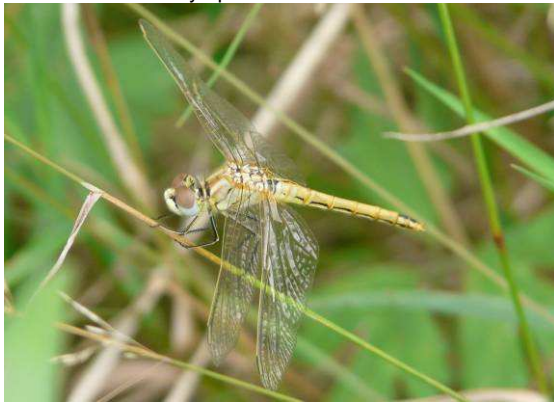
Sympetrum fonscolombii femelle immature