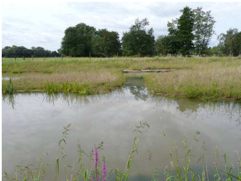
Exemple de seuils d'alimentation entre deux mares.

Il a donc été décidé de retravailler l'interconnexion des différentes mares en abaissant de quelques centimètres les différents seuils d'alimentation. Les travaux ont eu lieu début mars 2010.