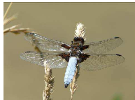
Libellula depressa mâle