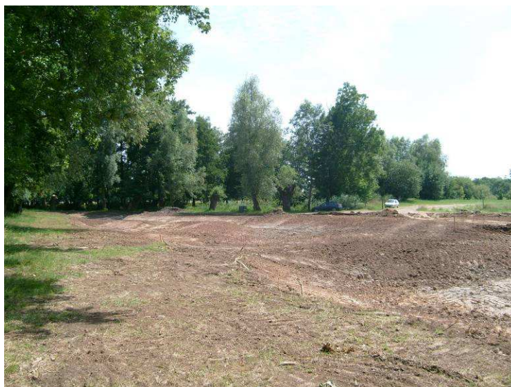
Nivellement aval terminé : 29/06/2009