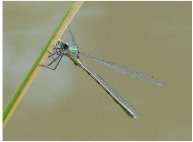
Chalcolestes viridis mâle