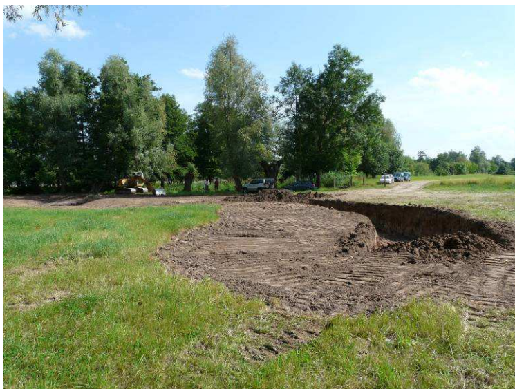
Travaux en cours : 18/6/2009