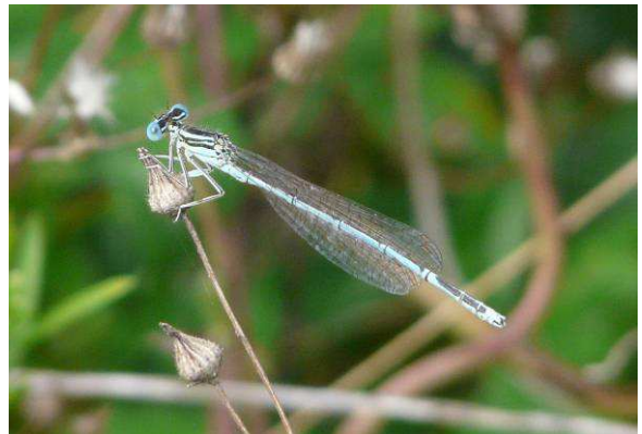
Platynemis pennipes mâle