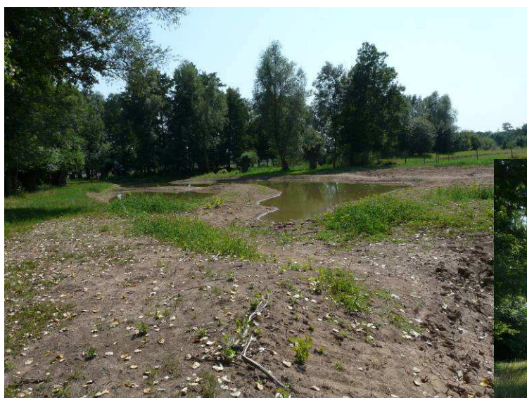
Premier été : une partie des mares s'assèche

Les hélophytes plantées à l'automne 2009 Sont à présent bien développées (13/08/2010)