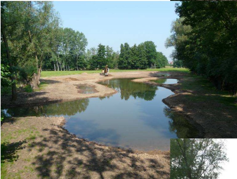
Chantier en cours après mise en eau : 02/07/2009