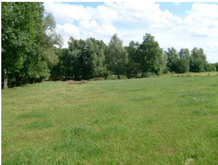
Au démarrage des travaux : 16 juin 2009