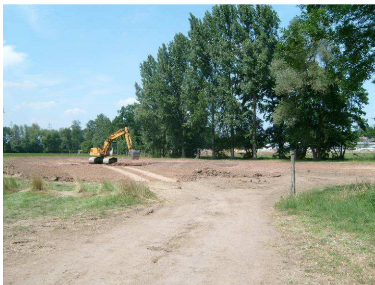
Alignement de peupliers de cultures abattus en novembre 2009

Ces peupliers rejetant sur souche et par rejet des drageons, une intervention annuelle est nécessaire pour éliminer progressivement cette espèce. Une fauche tardive annuelle du site est prévue chaque année en automne.