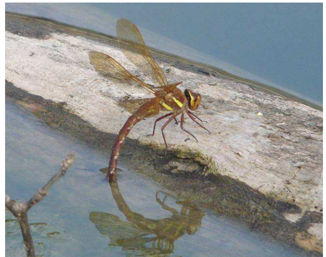
Ponte d' Aeschna grandis