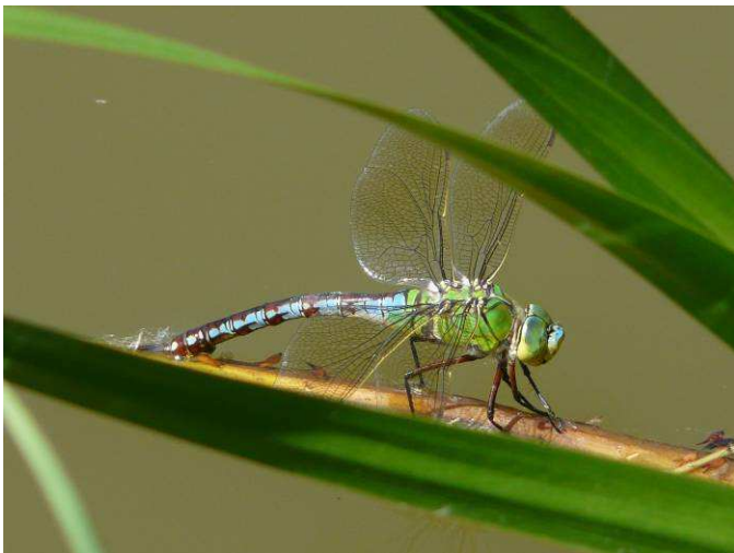
Ponte d' Anax imperator

15 espèces de libellules ont déjà été observées sur ce site avec preuve de reproduction pour 8 d'entre elles (observations d'immatures, d'accouplements ou de pontes). Parmi les espèces remarquables, on peut noter : le Sympétrum à nervures rouges ( Sympetrum fonscolombii ) dont deux immatures ont été observés (LR : vulnérable), la grande Aeschne ( Aeschna grandis ) vue en train de pondre (LO : patrimoniale) et la Libellule écarlate ( Crocothemis erythraea ) et l' Orthétrum brun ( Orthetrum bruneum ) (toutes deux LO : à surveiller).