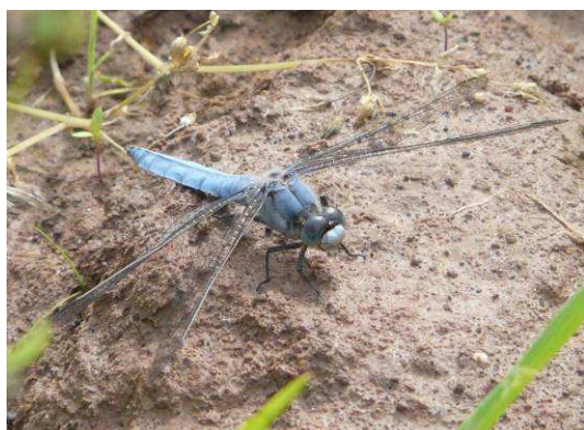
Orthetrum brunneum mâle