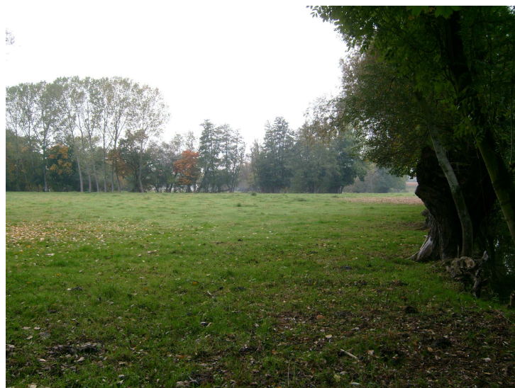
Vue du site avant travaux