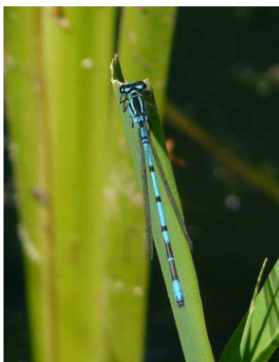
Coenagrion puella mâle