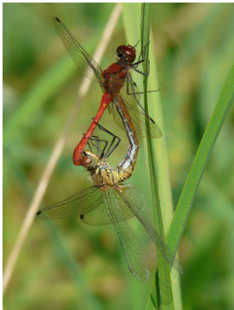
Accouplement de Sympetrum sanguineum