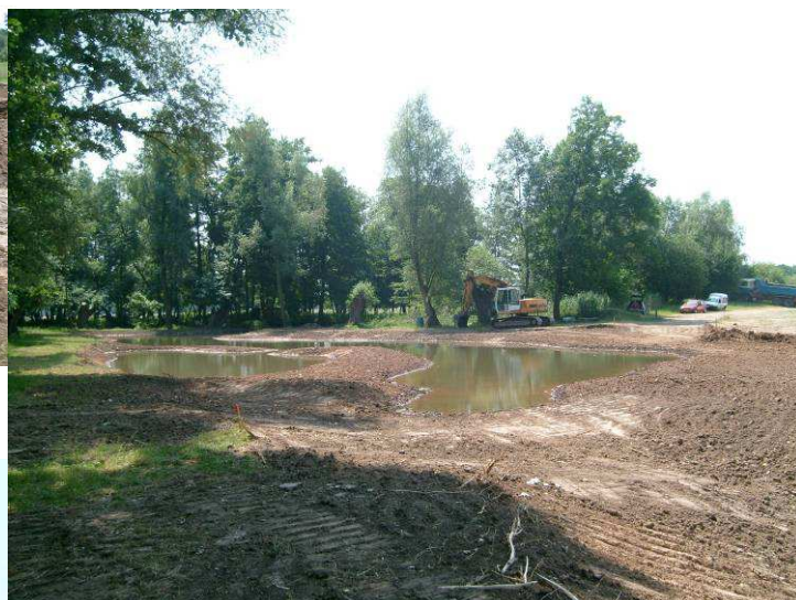
Juste après mise en eau : 01/07/2009