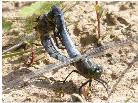
Accouplement d'Orthetrum cancellatum