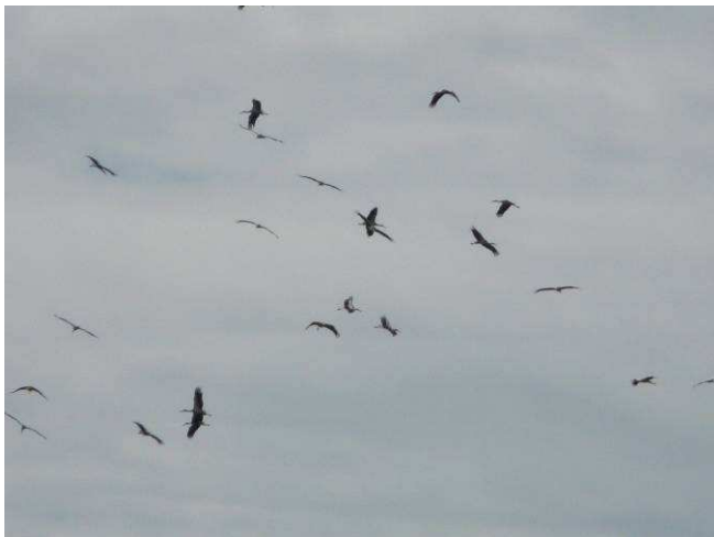
Rassemblement de cigognes blanches