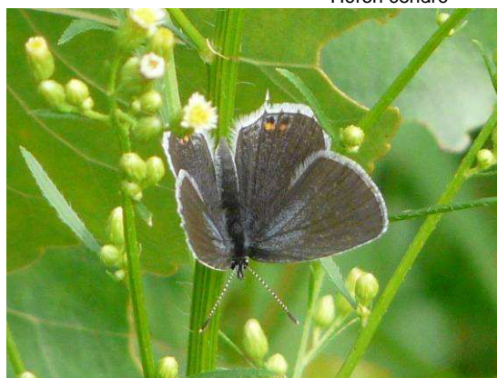
Everes argiades femelle