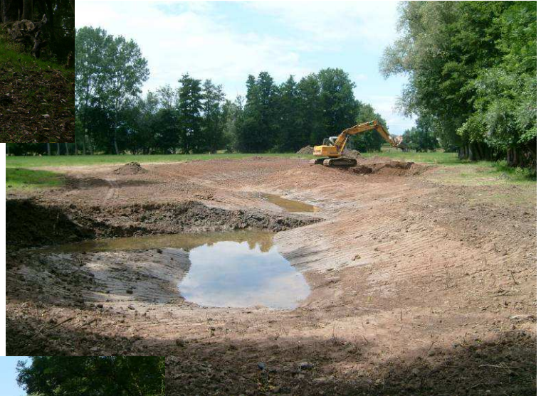
Chantier en cours avant mise en eau : 22/06/2009