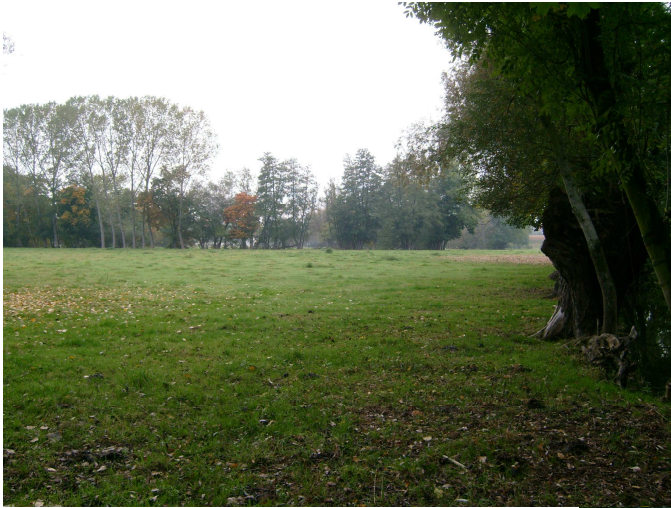
Vue avant travaux