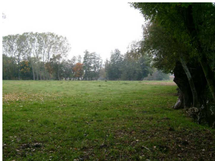
Vue du site avant travaux