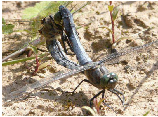
Accouplement d' Orthetrum cancellatum