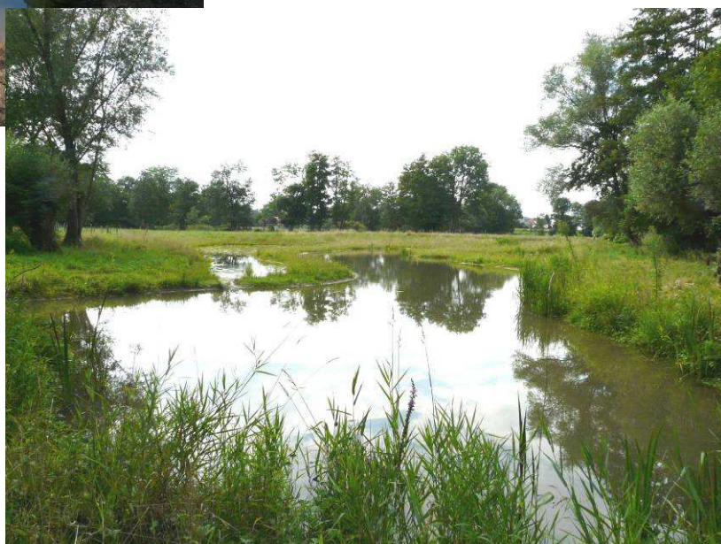
Vue du 13/8/2010 : On peut apercevoir au fond la suppression des peupliers de cultures, coupés à l'automne 2009.