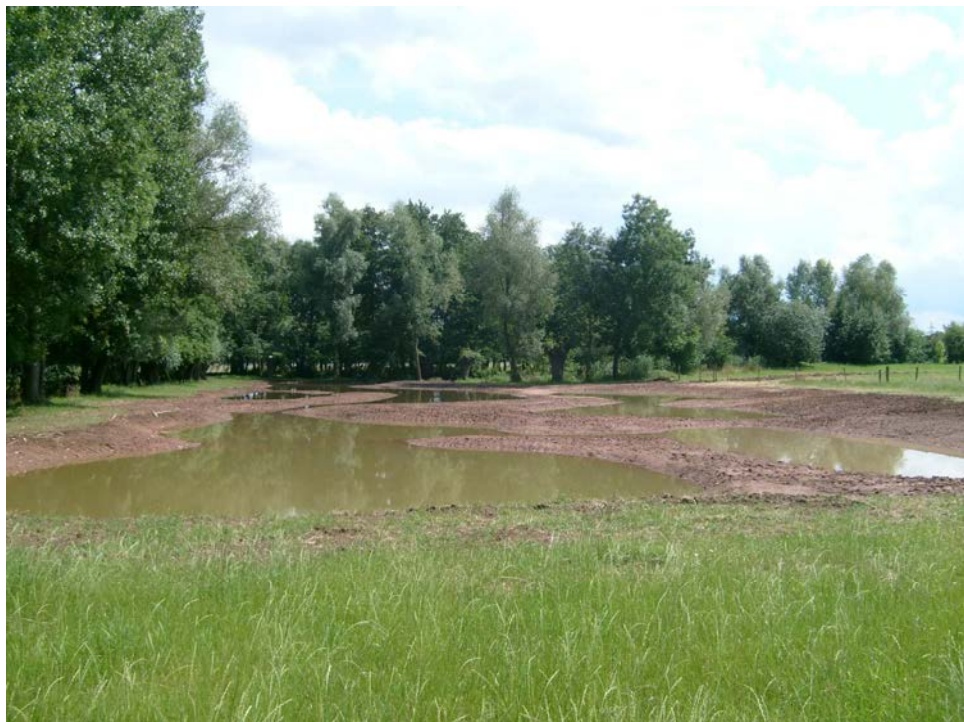
Vue générale du site après mise en eau de l'ensemble des mares : 06/07/2009

Les travaux, d'un montant de 81 840 € TTC ont été subventionnés par l'Agence de l'Eau Rhin Meuse à hauteur de 50 % et par le Conseil Général du Bas-Rhin à hauteur de 30 %.