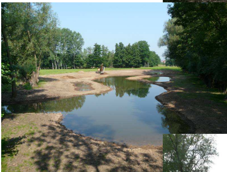
Chantier en cours après mise en eau : 02/07/2009