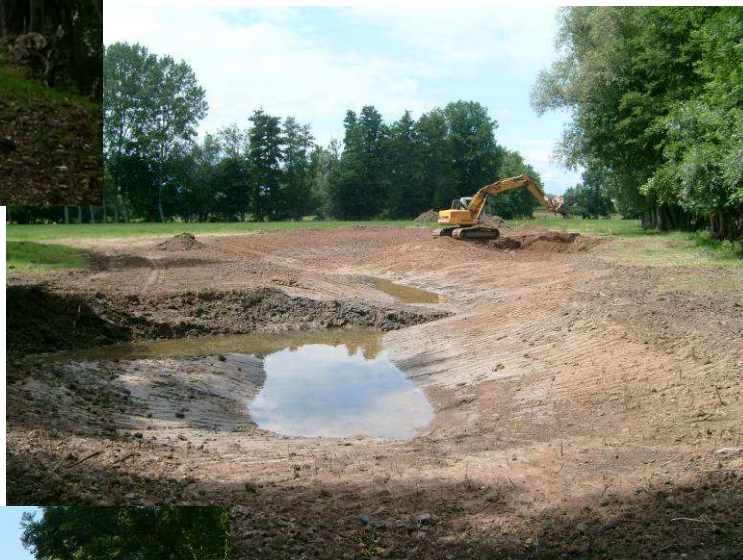
Chantier en cours avant mise en eau : 22/06/2009