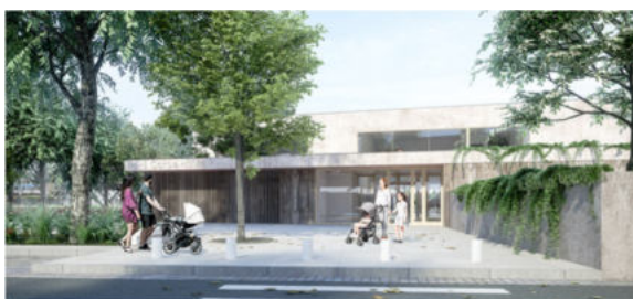
MPE rue des fleurs/Carpe-Haute