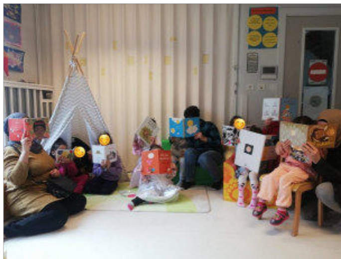
Exemple : JE STOLTZ 2021 et LAPE Meinau

L'ensemble de ces dispositifs permet d'accueillir au mieux les enfants porteurs de troubles du développement et/ou d'handicap.