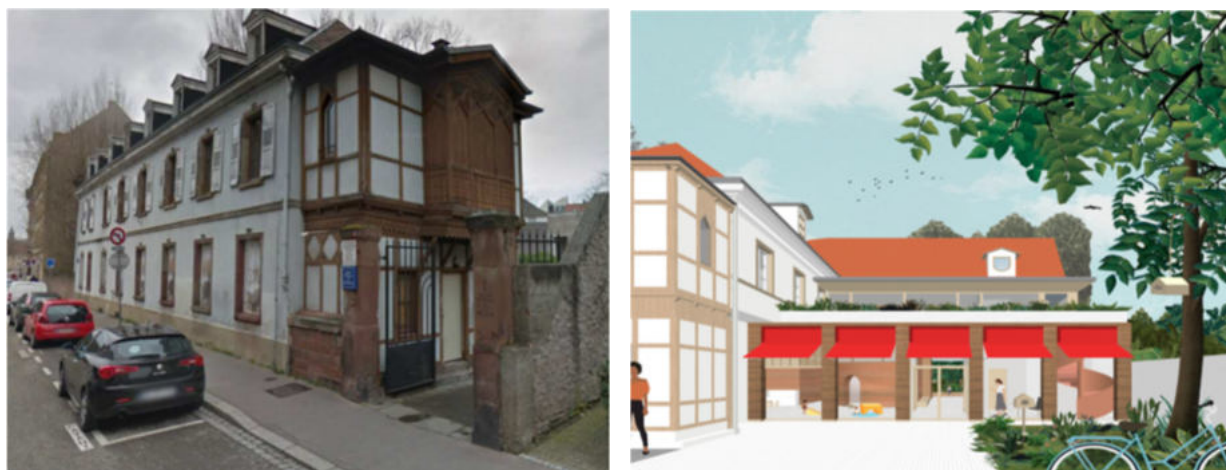
Maison de la petite enfance Finkwiller Avant / Après

Livraison septembre 2025 - Coût : 3,040 M€