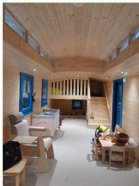
Première crèche nature de Strasbourg « La petite Roulotte »