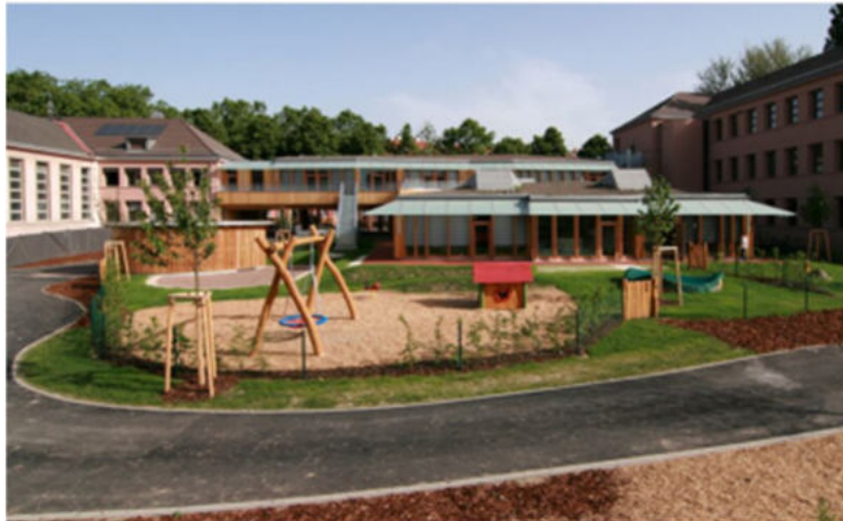
Maison de la petite enfance franco-allemande