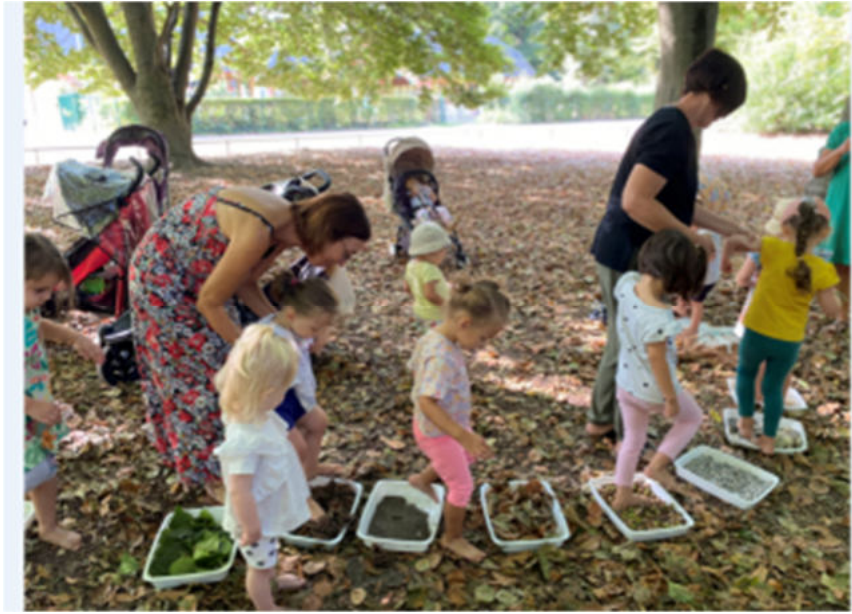
Sorties et réalisations enfants / assistant-es maternel-les