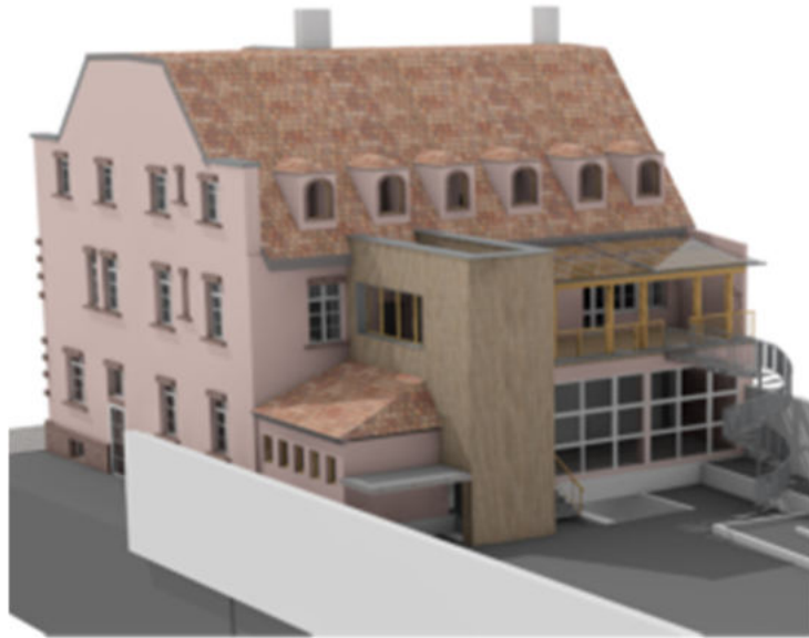
Maquette du futur EAJE Fritz rénové avec la pose d'un ascenseur, et des espaces de vie pour enfants plus adaptés aux moins de 3 ans

→ Le jardin d'enfants Halte-garderie Bâle va bénéficier de travaux afin d'offrir 60 places d'accueil pour des enfants de moins de 3 ans. L'établissement sera fermé à partir de septembre 2024. Les travaux consistent à aménager des unités de vies pour 15 enfants avec des espaces de sommeil et des espaces sanitaires en liaison fonctionnelle. Une cuisine sur site, ainsi que des espaces dédiés au personnel sont également prévus. L'espace extérieur va bénéficier d'une végétalisation.