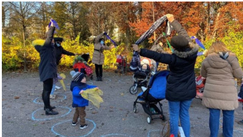
Sortie enfants / assistant.es maternel·les