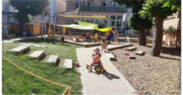
Cours des EAJE Indre, Fritz et Bâle