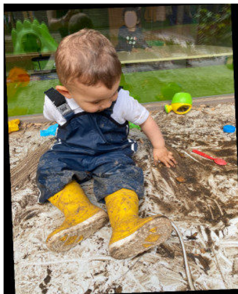
Sortie nature dans un parc / manipulation de la terre à la MPE Koenigshoffen

Les enfants sont plus vulnérables que les adultes car leur système immunitaire n'est que partiellement développé. Garantir un environnement sain pour l'enfant est une priorité qui demande une attention et une mobilisation dans tous les domaines.