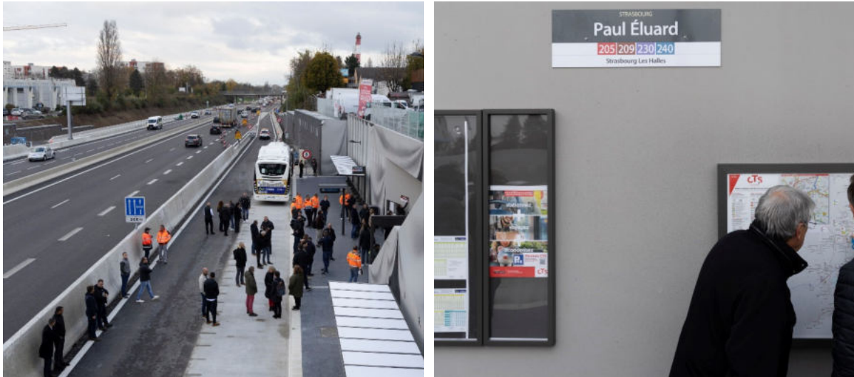
© Jérôme Dorkel pour Strasbourg Eurométropole

Le démarrage de la section suivante, entre la centrale de HautePierre et la sortie Place des Halles sur la M35, est planifié à l'été 2025 pour les travaux de la bretelle de sortie de la Place des Halles sur la M35.