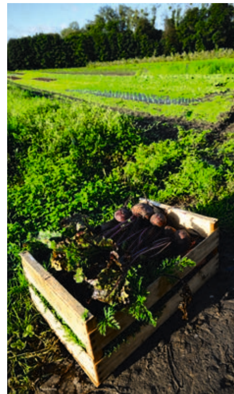
Un tiers des menus des cantines scolaires est composé de produits locaux. J. DORKEL

LÉGUMINEUSES LOCALES. « Les cantines sont un appui opérationnel du Projet alimentaire territorial (lire page précédente) », insiste l'agente. 50% des repas qui y sont servis sont issus de l'agriculture biologique, dont deux tiers produits localement. En tout, 30% des menus sont confectionnés avec des produits locaux, avec un objectif à atteindre de 60%. À ce titre, l'opération Fabuleuses légumineuses est une réussite. L'an dernier, ce sont 556 sites de restauration collective qui ont cuisiné, pendant une semaine, des repas à base de légumineuses produites localement, permettant ainsi de toucher plus de 106000 personnes. De quoi consolider et faire connaître la production territoriale. {AD}