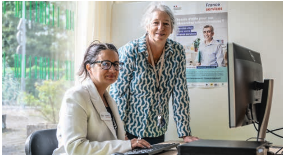
L'espace France services de Cronenbourg est co-financé par l'État, l'Eurométropole, la Ville de Strasbourg et la Collectivité européenne d'Alsace. A. HEFTI

Ouvert début septembre, l'espace France services de Cronenbourg rapproche les usagers des services publics.