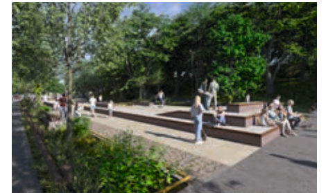
L'équipement s'adressera en priorité aux skateurs.

Lauréat du budget participatif en 2019, le skatepark de la Citadelle sera livré en février.