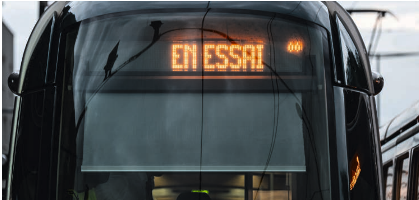
Huit nouvelles stations de tram relieront l'ouest de l'agglomération au centre-ville strasbourgeois. A. HEFTI