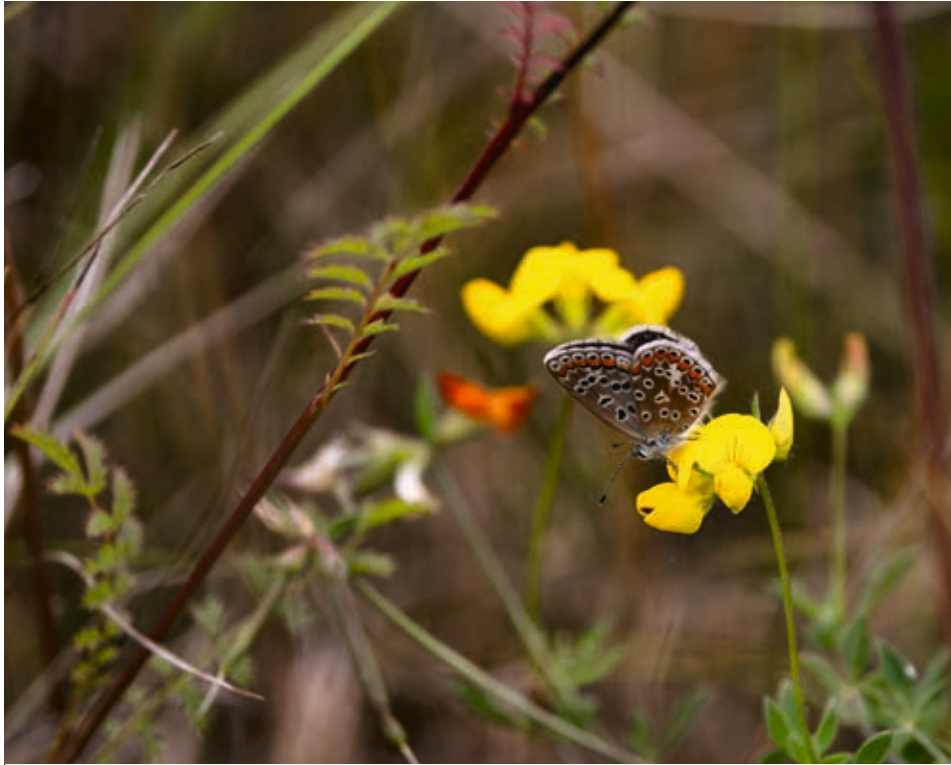
Implantée entre l'autoroute et la forêt du Neuhof, cette zone présente une biodiversité riche. J. DORKEL