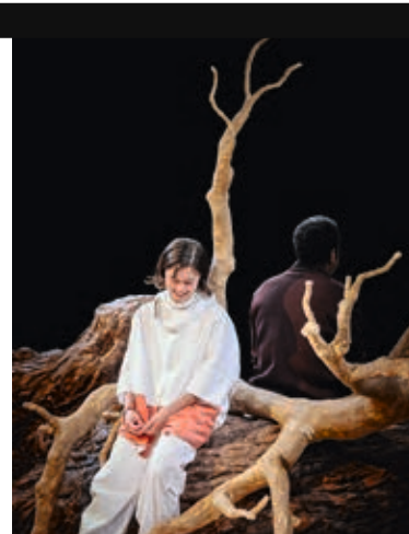
Un dialogue à travers le temps et l'espace.

C'est le grand retour du directeur du Festival d'Avignon au Maillon avec sa dernière pièce, créée cet été. Un duo, à la manière du sublime Antoine et Cléopâtre , où l'amour de deux puissants se heurtait aux enjeux du monde. Cette fois, un père et sa fille dialoguent à distance: lui, médecin coincé sur Terre, dans les seventies , elle recluse sur Mars avec « les oubliants » qui ont déserté leur planète d'origine en totale décrépitude. Comme eux, elle a signé un protocole d'oubli effaçant, chaque jour un peu plus, les souvenirs de sa mémoire. Le temps leur est compté. Si le père voulait changer le monde, la fille a changé de monde. En échanges de missives, textos, lettres, les déclarations larvées deviennent aveux et les reproches fusent. Placés dos à dos, leurs regards nous sont offerts dans le tournoiement fou d'un plateau multipliant les révolutions planétaires sur lui-même. Il nous laisse ivres face au vertige d'un futur plein de deuils irréversibles et d'incompréhensions