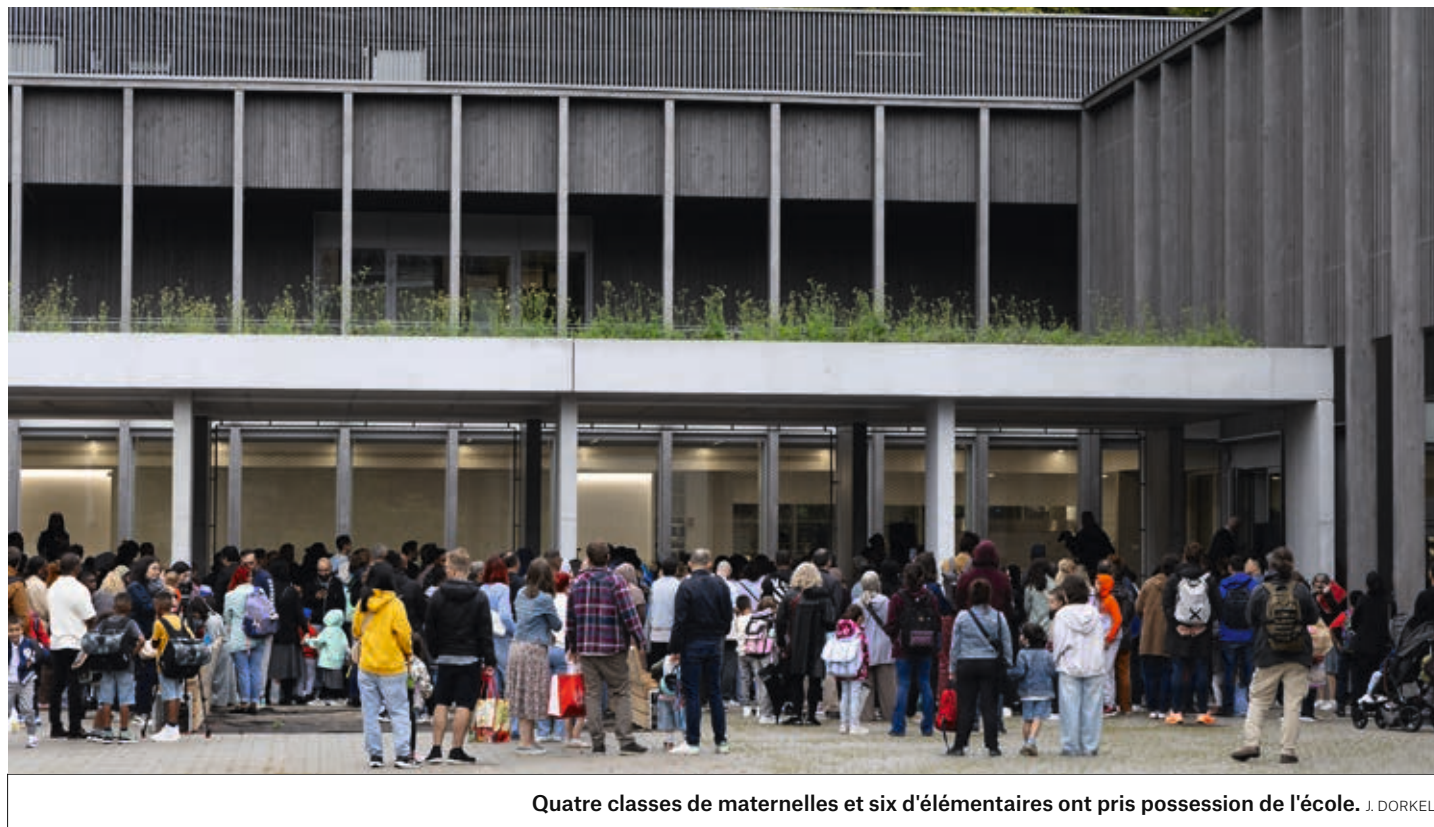
Quatre classes de maternelles et six d'élémentaires ont pris possession de l'école. J. DORKEL

climatique. «Le bâtiment atteint un niveau de performance énergétique passif, grâce notamment à une bonne isolation thermique et à l'installation de panneaux photovoltaïques en toiture», explique Alexis Delcroix, architecte du cabinet Weber et Keiling. Les extérieurs sont par ailleurs prévus pour drainer les eaux de pluie. Autre enjeu actuel, l'alimentation des enfants fait l'objet d'une attention toute particulière. L'école est en effet la deuxième à bénéficier d'une cuisine de production sur place, et les réfectoires ont été pensés pour favoriser des temps de repas agréables. La Ville de Strasbourg a investi 18,5 millions d'euros pour mener à bien ce projet. {LG}