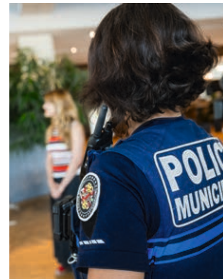
La police municipale a suivi une formation spécifique. P. STIRNWEISS

Les établissements de la collectivité permettront de mettre les victimes à l'abri.