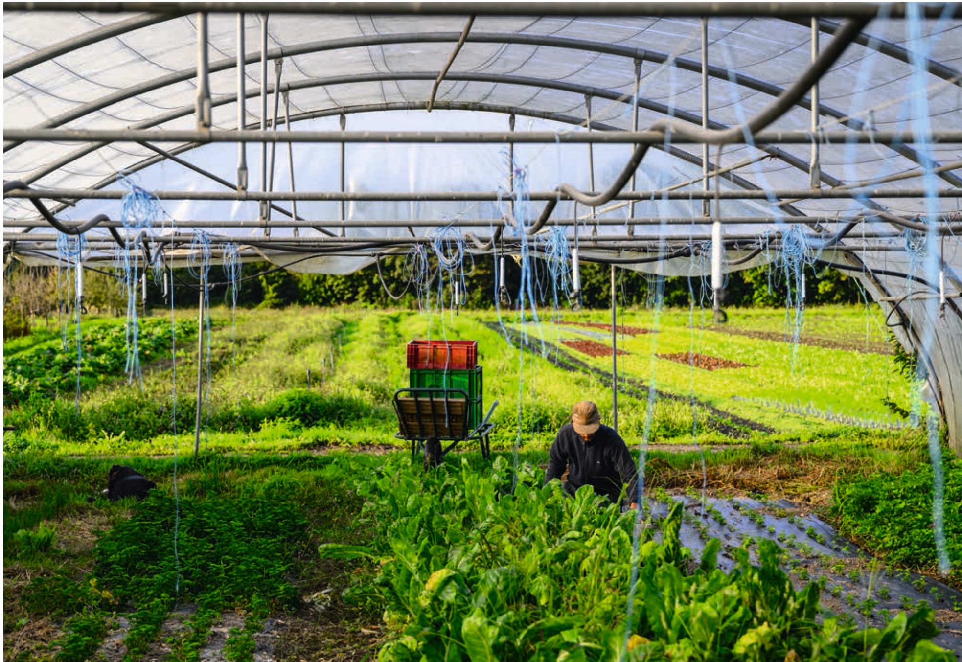
La ferme de la Ganzau cultive une cinquantaine de variétés de fruits et légumes bio. P. STIRNWEISS