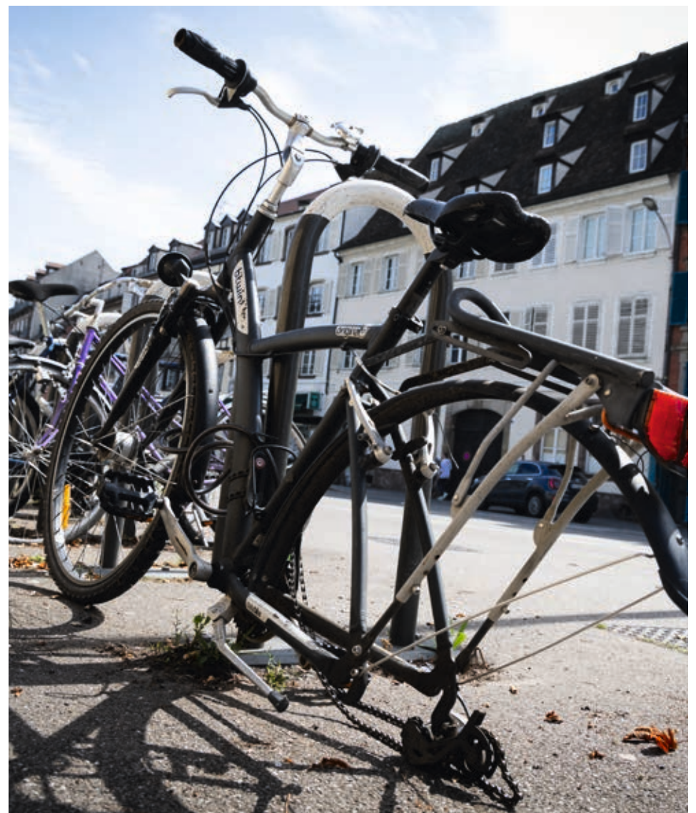
Les bicyclettes sont retapées par des structures d'insertion. J. DORKEL

RECYCLAGE. Les vélos-épaves, eux, ne sont pas pour autant perdus. L'Eurométropole a en effet passé une convention avec plusieurs associations et structures d'insertion sociale et solidaire qui s'emploient à ressusciter ces estropiés de la vie citadine, quitte à prendre les roues de l'un pour les installer sur le cadre de l'autre. {GR}