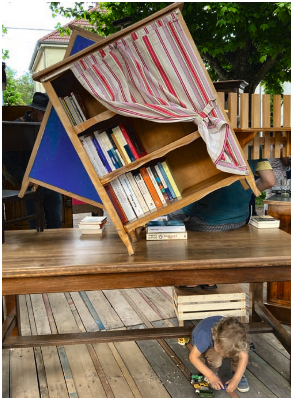
À Cronenbourg, l'idée retenue a pris forme en 2024 dans une version bricolée et provisoire.

La saison 3 du budget participatif a livré ses lauréats, à l'issue d'une phase de vote qui a départagé les 115 idées proposées par les Strasbourgeois-es.