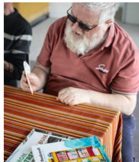
Les projets artistiques et de loisirs favorisent la rencontre.